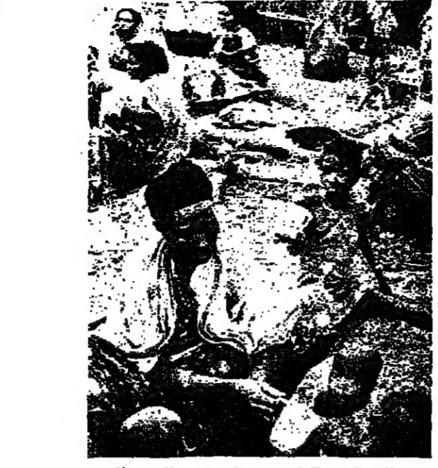
اللاجئون الاثيوبيون في الصومال

١٥) بموجب بروتوكول ملحق بدستور البريد العالمي : (١) كل دولة عضو في منظمة الامم المتحدة يحق لها الانضمام إلى الاتحاد ، (٢) كل دولة سيادية ليست عضوا في المنظمة الدولية يحق لها ان تطلب الموافقة على عضويتها في الاتحاد .